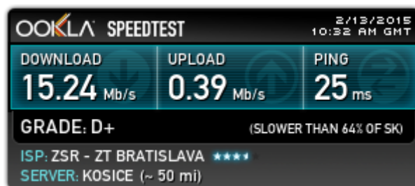
Obrázok 3 Šírka pásma pripojenia

Každý počítač je pripojený na internet cez wifi. V súčasnosti je vybudovaná na OcÚ počítačová sieť s rýchlosťou: